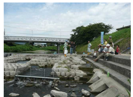
桜堤公園のデルタフリーによる実験魚みち作り（遡上実験実施）(09.8.23)

今後、ますます地域の住民が中心となって、自分達の暮らしている芥川を知ることが重要になってくると思います。その地域のことを一番よく知っているのは、私たちなのであります。