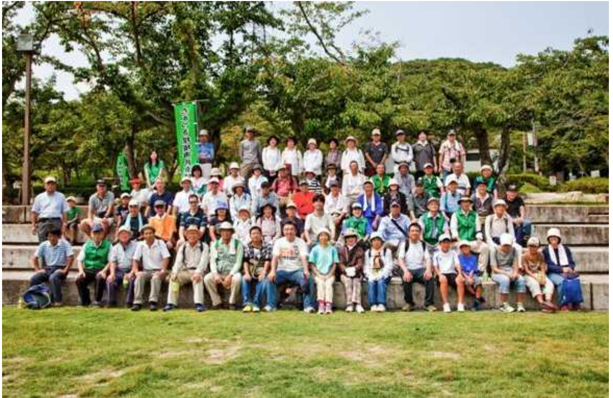
摂津峡クリーンハイキング参加の皆さん