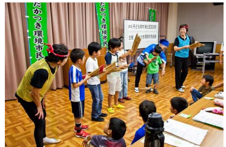
試験の合間に南京玉すだれを体験