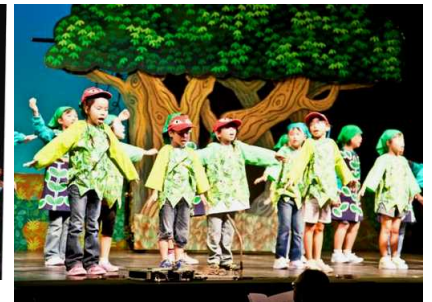
子ども達のミュ・ジカルダンス