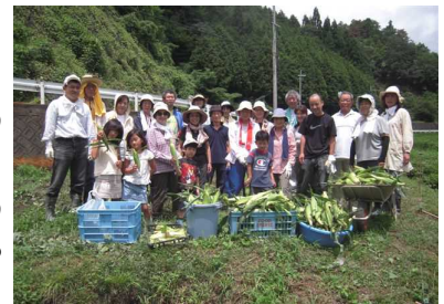
とうもろこしを前にポーズ