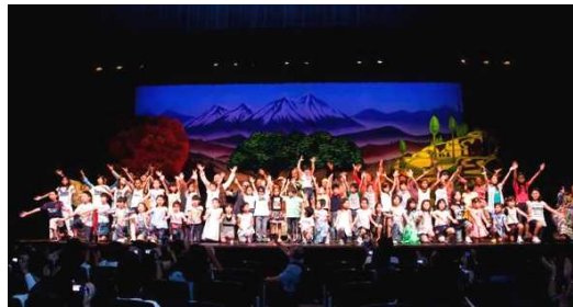
みんなでフィナーレ

今回は歌、お芝居、ダンスを織り交ぜたミュ・ジカルを鑑賞することを通して、地球温暖化や自然との共生といった環境問題について、多くの市民に気づいて頂くと言う主旨で開催されたものです。体験講座に参加してくれた子どもたちは、ミュ・ジカルの一部を演じ体験することで「環境を守る事は大切な事だ」と感じとってくれたようでした。